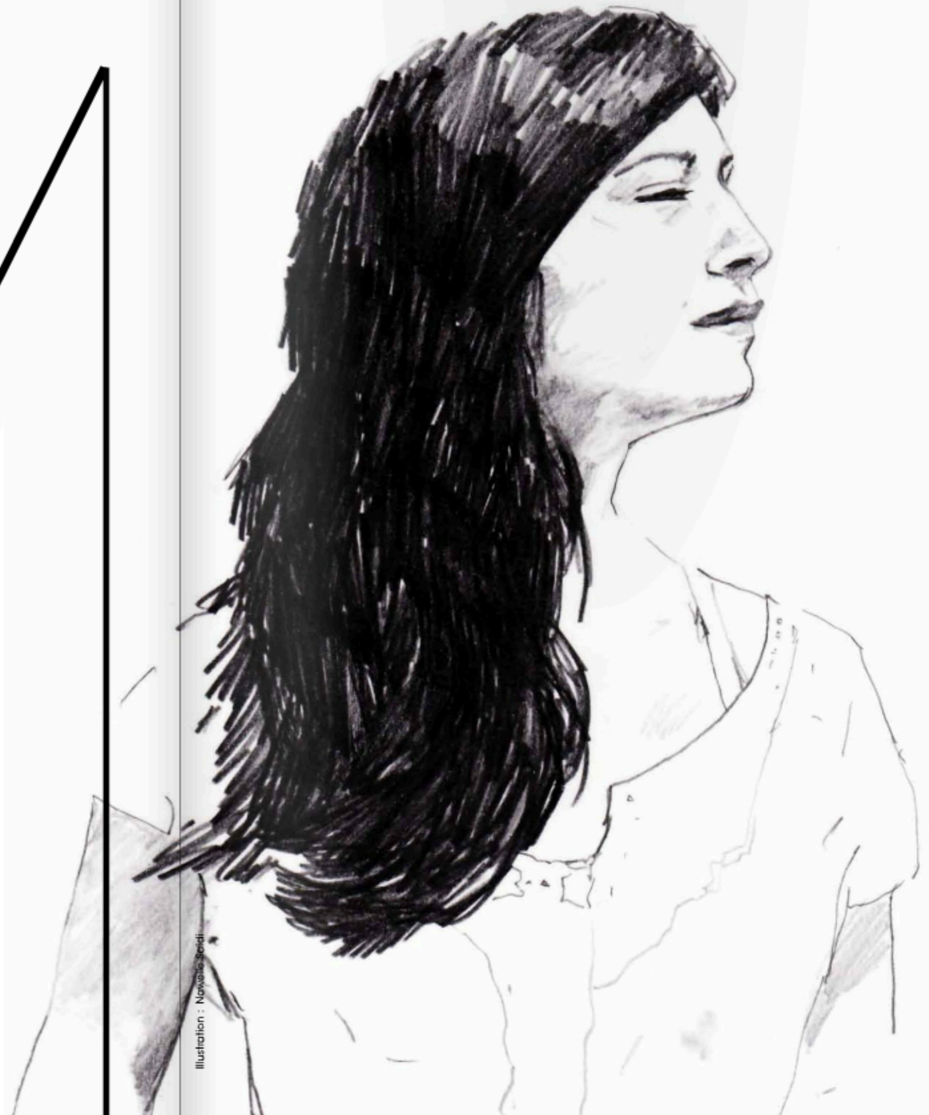
Illustration : Nonna